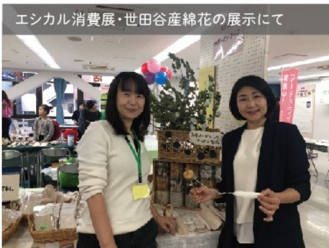
エシカル消費展・世田谷産綿花の展示にて

について再考すべき時期になっています。世田谷では現在もプラスチックを燃えるごみとして処理しています。プラスチックごみの分別収集を行い、市民の使用抑制を喚起し、清掃工場問題と合わせ、ごみ減量に向け今後も取り組んでいきます。