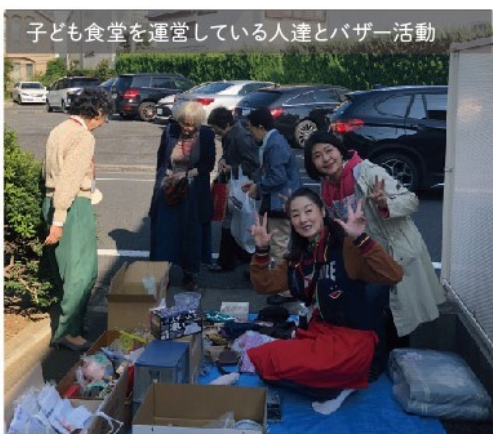
子ども食堂を運営している人達とバザー活動