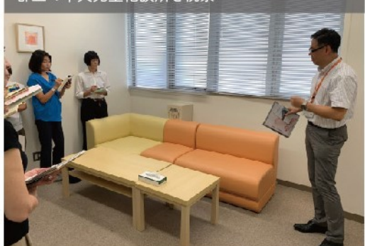
都立の中央児童相談所を視察

そこで、10代の妊娠など予期せぬ妊娠により、明らかに実親の養育が困難な場合については、赤ちゃん縁組を行うことができる体制づくりや、里親への支援の充実など、世田谷区独自の体制整備が進んでいます。今後も区立の児童相談所開設にむけて取組を求めています。