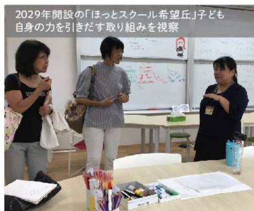
2029年開設の「ほっとスクール希望丘」子ども自身の力を引きだす取り組みを視察

教育総合センターに整備する乳幼児教育支援センターでも「子どもたちの探究的な遊びと学びを推進するカリキュラム」「ICT等を活用した教材の導入・実践・普及」をテーマとしています。乳児期は、ぬくもりを感じ、人の目をみて表情を真似し、物を口にいられてみたり、指でつまんだり、一つ一つを認識しながら五感が発達する大事な時期です。そして、幼児期には、本物にふれ、自然の体験をかさねることに重点をおくべきではないでしょうか。ICT等の活用はもつと先でも遅くありません。必要な時期を見極めて効果的な使い方をすることが大切です。せっかくの育つ力をつまみように、子どもの生きる力を育むセンターとなるよう求めていきます。