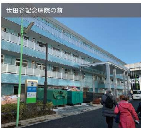
世田谷記念病院の前

来年は「世田谷区地域防災計画」改定の時期です。防災会議のメンバーとして、いざという時に役立つ防災計画になるように提案していきます。