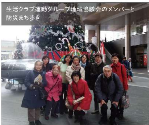
生活クラブ運動グループ地域協議会のメンバーと防災まち歩き