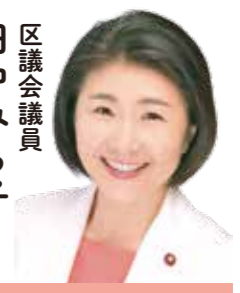
区民生活常任委員会 オリンピック・パラリンピック等 特別委員会