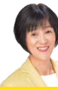
文教常任委員会 災害・防犯・オウム問題対策等 特別委員会