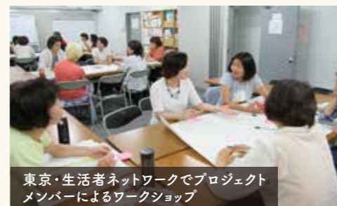
東京・生活者ネットワークでプロジェクトメンバーによるワークショップ