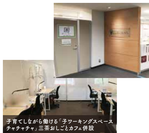
子育てしながら働ける「子ワーキングスペースチャチャチャ」三茶おしごとカフェ併設

生活者ネットワークは市民と議会・行政をつなぐパイプ役として、地方議会に議員を送りだしています。