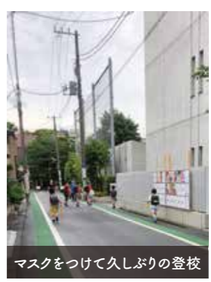
マスクをつけて久しぶりの登校

ＩＴＣ教育への期待が高まり、今後はＩＴＣの良さを生かしながら、通常の授業も並行して進めていくこととなります。この両立には、先生の使いこなし技術はもちろん、子ども一人ひとりに対する丁寧な目配りが