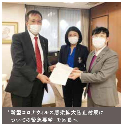
「新型コロナウイルス感染拡大防止対策についての緊急要望」を区長へ

により地域経済の循環を促すような持続可能な社会構造にシフトしていくことが必要です。この間、社会を支える縁の下の力持ちともいえるような職種、いわゆるエッセンシャルワーカーの方々の重要性に特に注目が集まりました。緊急事態宣言による保育の自粛中、施設への公的補助金は満額支払われていたにも関わらず、一部の保育園では、パート従業員への給料が支払われず休業手当の対象にもならないという事態が生じています。女性に集中しているケア労働、特に非正規雇用者への不平等な扱いを是正し、同一価値労働同一賃金の実現が必要で、介護分野では、利用する高齢者が感染防止のため利用を控えたため経営が厳しくなっているという声が、区内事業者からも聞こえています。これを機に離職する方も多く、今後の支え手確保は更に大きな課題です。社会全体で高齢者を支