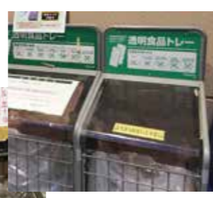
スーパー等で事業者による回収も

外出自粛、レストランなどの営業縮小で飲食物の持ちかえりや配達が増え、プラスチック容器の利用が増えています。世田谷区では透明プラスチックは、月2回の拠点回収とエコプラザ用賀、リサイクル千歳台への持ち込みでしか回収していませんでした。全て手渡し回収だったため、コロナ緊急事態期間には回収を停止していました。海洋プラスチック汚染問題などプラごみが注目され、削減