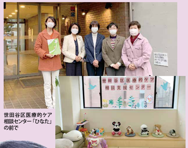
世田谷区医療的ケア相談センター「ひなた」の前で

世田谷区では、医療的ケア相談センターを設置し、さまざまな相談への対応を行うとともに、在宅生活を支える計画や災害時個別の支援計画などの作成も行っています。今後は、保育園や学校へ通うお子さんを支援するためにも保健、医療、福祉、教育等の連携を一層推進していく必要があります。